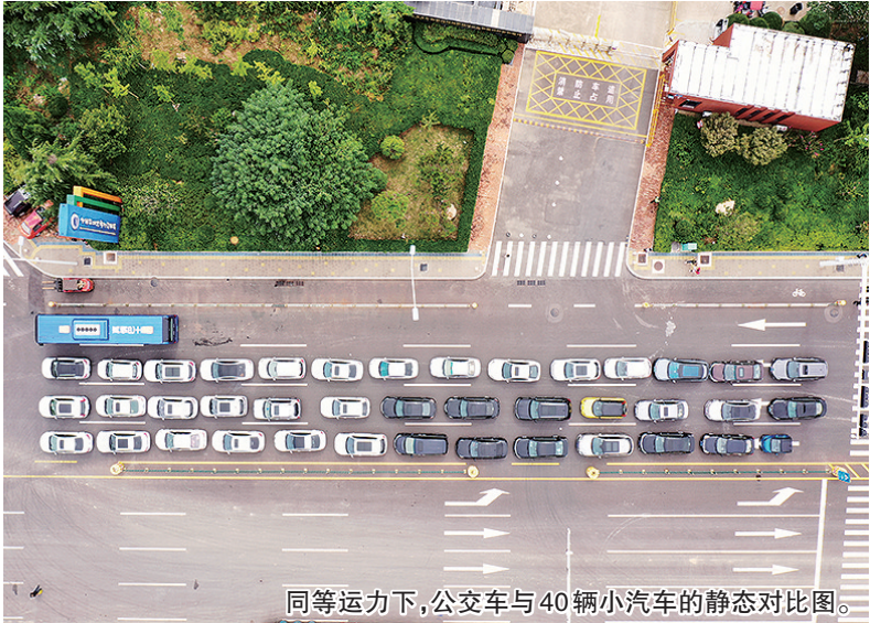
同等运力下,公交车与40辆小汽车的静态对比图。

在经济方面,以1辆1.6L排量的普通小汽车为例,每公里油耗约0.07升,按一年平均行驶里程1万公里,仅一年燃料费约需5656元(油价8.08元/升),加上保险保养等费用,年费用超9000