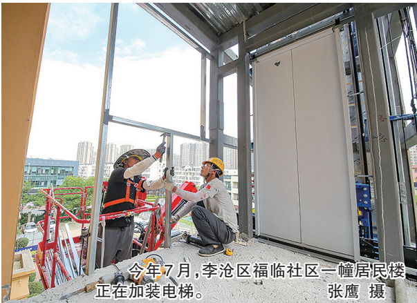
今年7月,李沧区福临社区一幢居民楼正在加装电梯。