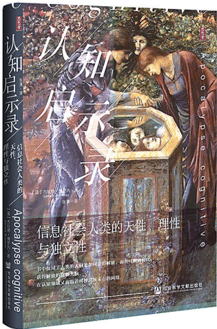
《认知启示录》 [法]杰拉德·博罗内 著 张潇 译 社会科学文献出版社 2023年8月出版