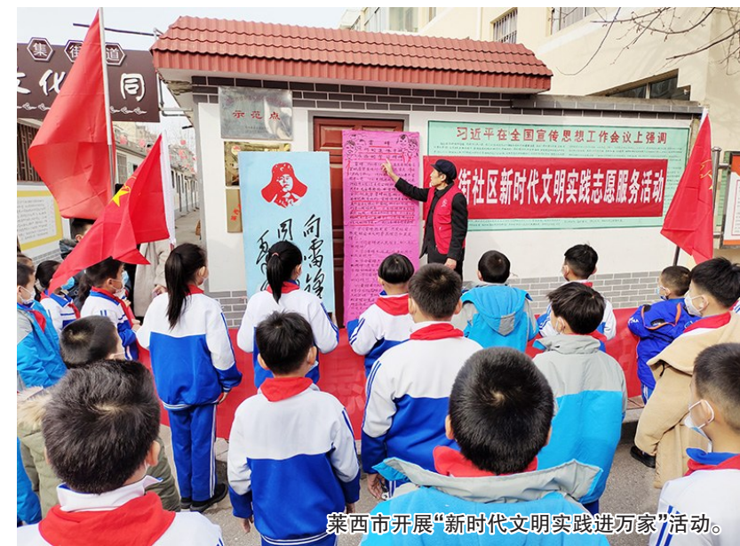
莱西市开展“新时代文明实践进万家”活动。

本报9月14日讯 为打通志愿服务“最后一公里”实现文明实践的“精准滴灌”,莱西市线上打造集志愿服务项目、积分采集兑换对接等功能于一体的“上善莱西”数字平台,形成文明实践志愿服务“群众点单—中心(所、站)派单—志愿组织(者)接单—群众评单—政府奖单”的“五单”运行流程,引导优质志愿服务资源直接下沉,为群众提供专业便捷的“靶向”服务。