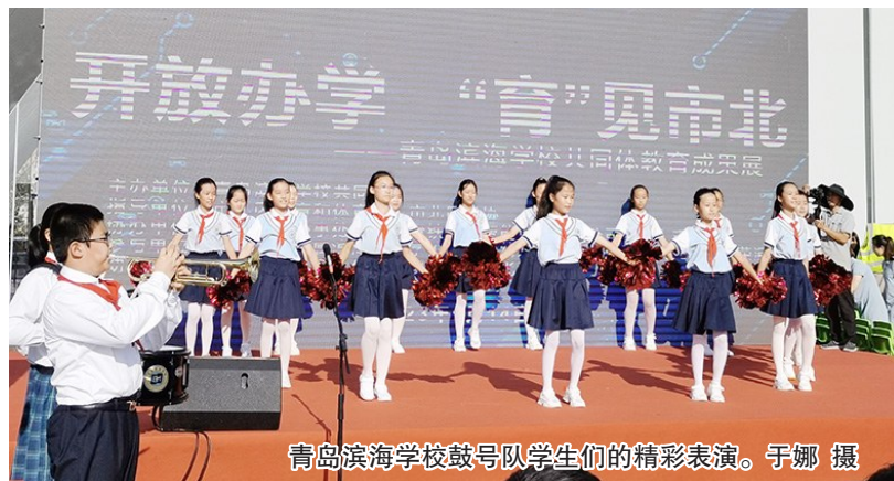
青岛滨海学校鼓号队学生们的精彩表演。

本报9月14日讯 为进一步贯彻家、校、社协同育人理念,让市北教育和学校的高质量发展特色成果更好地呈现给社区居民,9月14日,青岛滨海学校共同体成员校联合举行“科创滨海 共育未来”共同体教育成果展示活动。