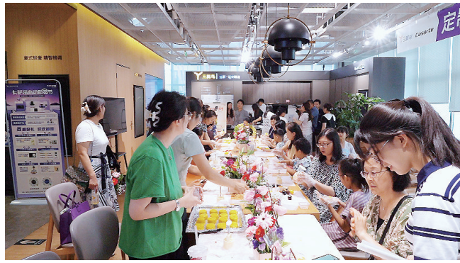
教师携家属动手做月饼。