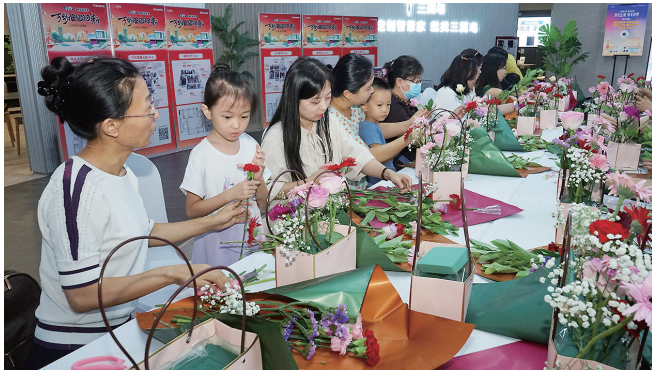
教师们带孩子一起学插花。

老师如烛光,燃烧自己,照亮莘莘学子前行路。繁忙的工作让他们平日与家人也难得有欢聚的机会。在第39个教师节到来之际,9月9日,青岛晚报掌控传媒与海尔智家青岛分公司携手举办“卡萨帝烘焙臻享荟”,在位于三翼鸟卡萨帝青岛体验中心001活动现场,来自岛城多所学校的一线教师们和家人一起,通过DIY插花、智慧烹饪、互动抽奖、集体合唱等轰趴活动,在充满科技感和智慧化的温馨环境里放下烦恼品味幸福,感受和家人朋友在一起的专属生活美,共庆教师节。