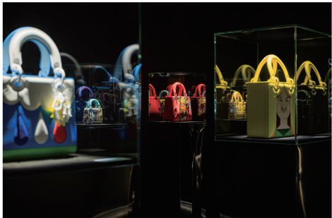
2023年青岛“DIOR LADY ART #1-7”艺术家限量合作系列展览现场