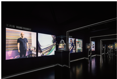
2023年青岛“DIOR LADY ART #1-7”艺术家限量合作系列展览现场