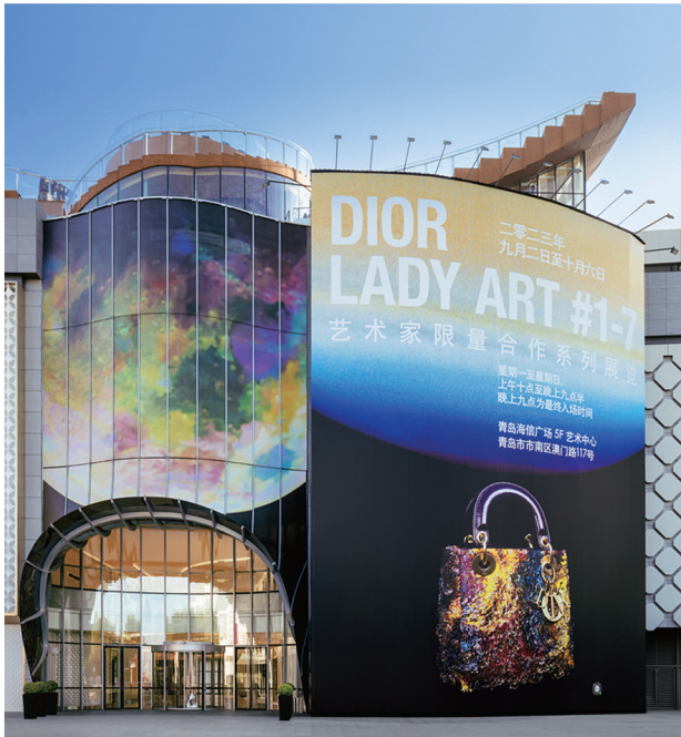
2023年青岛“DIOR LADY ART #1-7”艺术家限量合作系列展览现场

睿、王光乐、宋冬、张洹以及王郁洋,这几位杰出艺术家交织传承与革新,融蕴迪奥经典风貌与个人艺术风格,以独具个性的视角创新诠释这一传奇手袋的魅力之姿,彰显中国艺术家的先锋创意,颂扬创意的无限可能。 展览开幕酒会现场星光熠熠,著名演员黄晓明,迪奥中国品牌大使郎朗,迪奥中国品牌大使王俊凯,迪奥中国品牌挚友吉娜·爱丽丝、孙一文、侯明昊、孙伊涵和王佳怡,均身着迪奥礼服,与到场嘉宾共享艺术盛宴。