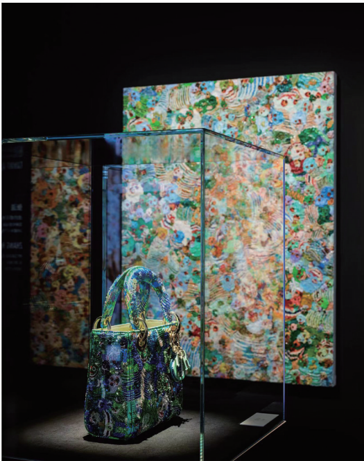
“DIOR LADY ART #6”艺术家限量合作系列张洹合作款手袋