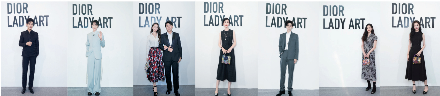
著名演员黄晓明 迪奥中国品牌大使王俊凯 迪奥中国品牌大使郎朗与迪奥中国品牌挚友吉娜·爱丽丝 迪奥中国品牌挚友孙一文 迪奥中国品牌挚友侯明昊 迪奥中国品牌挚友孙伊涵 迪奥中国品牌挚友王佳怡