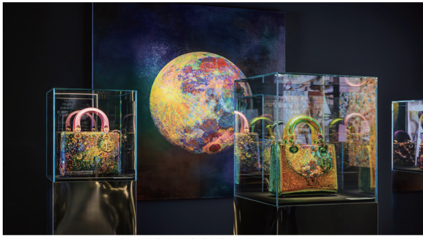
“DIOR LADY ART #7”艺术家限量合作系列王郁洋合作款手袋