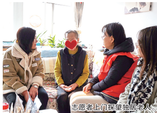
志愿者上门探望独居老人。

“一老一小”的幸福平安是千家万户的期盼。构建更周到的服务、更完善的社会保障体系,是关系保障和改善民生、促进国家长治久安、增强大国发展韧性的大事,也是我们的身边事。只有大家一起行动起来,用心用情用力解决“一老一小”急难愁盼问题,我们才能真正为“一老一小”托起稳稳的幸福。观海新闻/青島晚报/掌上青島 记者 魏笑 通讯员 于晶