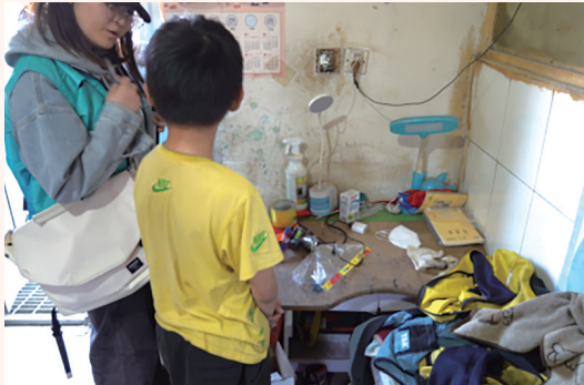
不少城市孩子也存在父母陪伴缺失的问题。