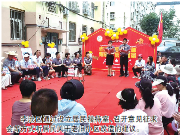
李沧区通过设立居民接待室、召开意见征求会等方式听居民关于老旧小区改造的建议。

本报8月29日讯 记者从李沧区城市更新和城市建设指挥部了解到，李沧区今年的老旧小区改造涉及到11个老旧片区的居民生活。为了让更多的居民早日受益，李沧区明年的这项工作已经启动，初步确定了60个小区的改造计划，将有更多居民的居住环境得到显著提升。