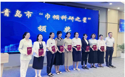
最美巾帼科创人颁奖现场。