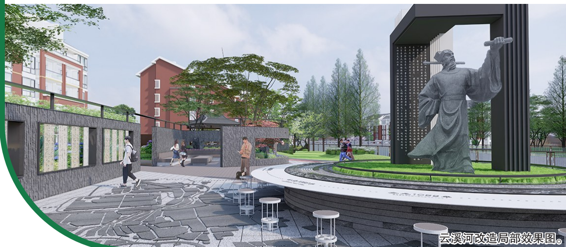
云溪河改造局部效果图。

云溪河沿线绿道慢行系统及周边景观提升,范围自龙州路至站前大道,共计实施云溪河沿线双侧绿廊总长约12公里,绿道及周边景观总占地面积约24公顷。项目计划在现有滨河景观用地的基础