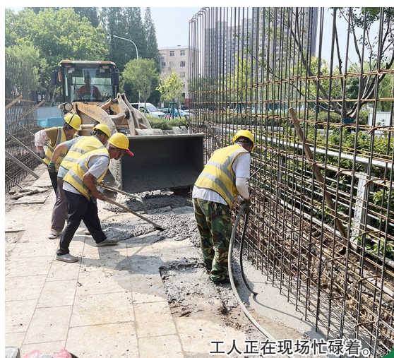
工人正在现场忙碌着。