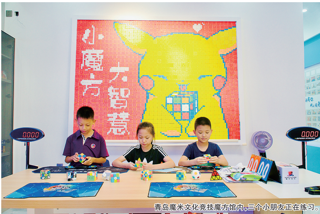
青岛魔米文化竞技魔方馆内，三个小朋友正在练习。