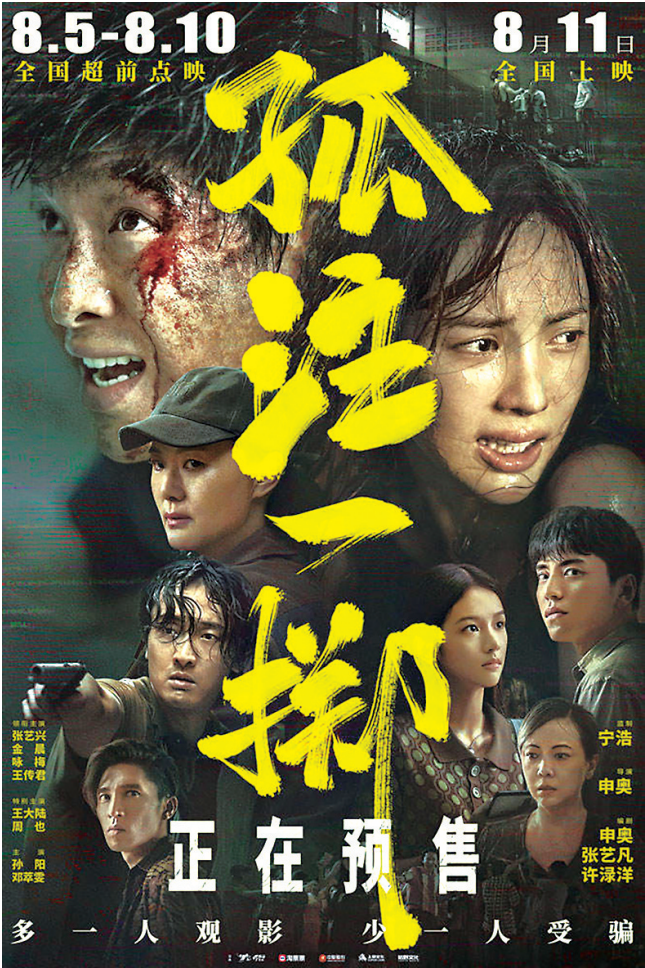
《孤注一掷》从预售点映票房就一路高歌猛进。