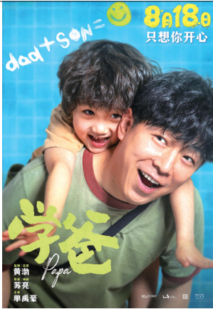
►黄渤导演主演的《学爸》喊你看“鸡娃”的当下。