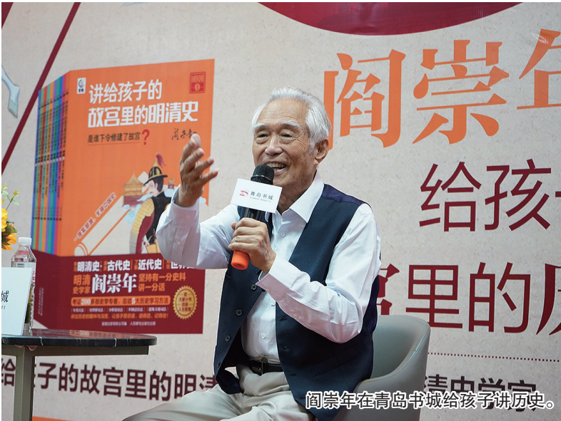
阎崇年在青岛书城给孩子们讲历史。

携新作《讲给孩子的故宫里的明清史》与岛城小读者交流，出席《阎崇年史学文颖集》首发式，开展翰墨小品展。近日，《百家讲坛》新格局的开创者、著名明清史学家阎崇年在岛城参与不同活动，为岛城大小读者展示他的“史学观”。 “国家把中国海洋大学放在青岛，真是太英明了。”阎崇年特别指出青岛海洋文化大有可为，《讲给孩子的故宫里的明清史》就特别强调了海洋文化，让小朋友从小就要重视海洋文化。”