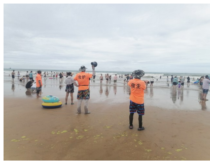
浴场工作人员巡查海岸线。

全，维护海水浴场治安秩序的稳定。据了解，为确保游客的人身安全，石老人海水浴场铺设了1200米的防鲨网，在海域游泳区设有符合识别要求的浮标和设有表示危险区域的标志牌，利用广播、LED显示屏不定时通报天气、海洋等信息，在防鲨网内按每200米设置一个救生观察岗，防鲨网内设4个救生观察岗，每个岗位安排2名