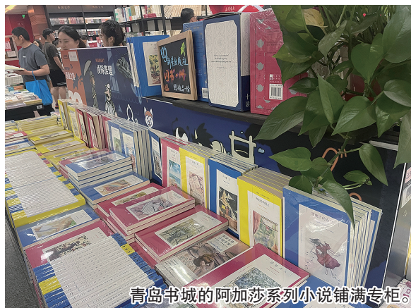
青岛书城的阿加莎系列小说铺满专柜。