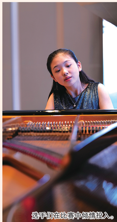
选手们在比赛中倾情投入。