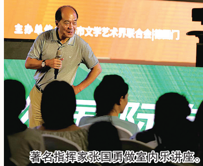
著名指挥家张国勇做室内乐讲座。

“期待2024年8月青岛再次相聚!”2023年7月22日—25日,第十一届门德尔松国际钢琴比赛亚太总决赛暨2023青岛国际钢琴邀请赛在青岛成功举办。大赛总监、天津音乐学院研究生导师冯键,在闭幕式上诚邀海内外选手明年继续相约青岛。青岛市文联党组书记魏胜吉表示:“青岛因音乐而更有魅力,音乐因青岛而更有情怀。我们相信,大赛的连续举办,会打造出全新的音乐教育城市文化品牌,厚植城市音乐艺术文化,持续增强青岛的城市艺术影响力和文化软实力,助力青岛音乐事业健康、有序、蓬勃发展。”