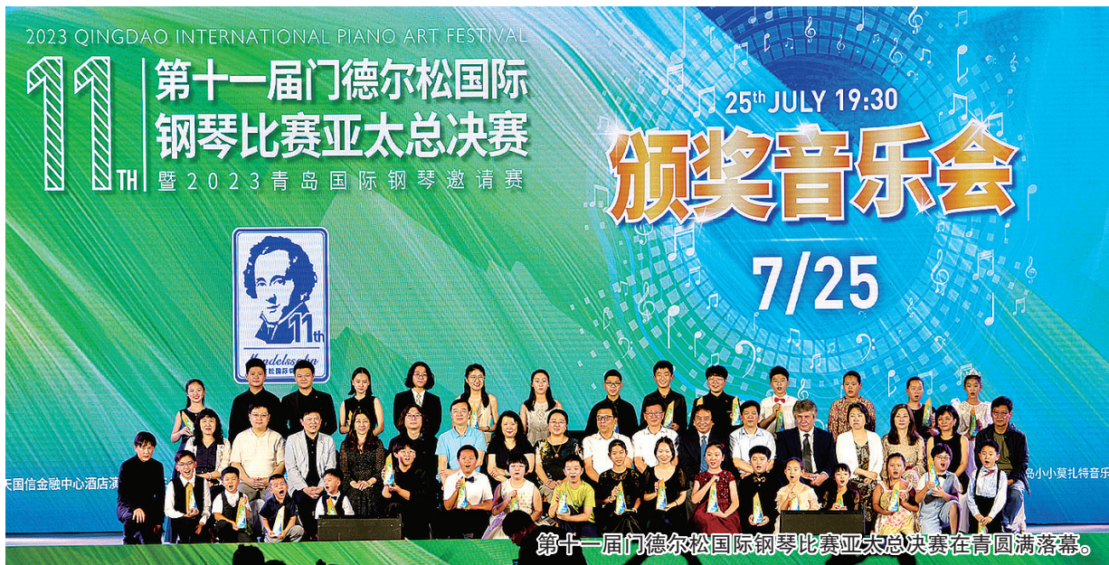
第十一届门德尔松国际钢琴比赛亚太总决赛在青圆满落幕。