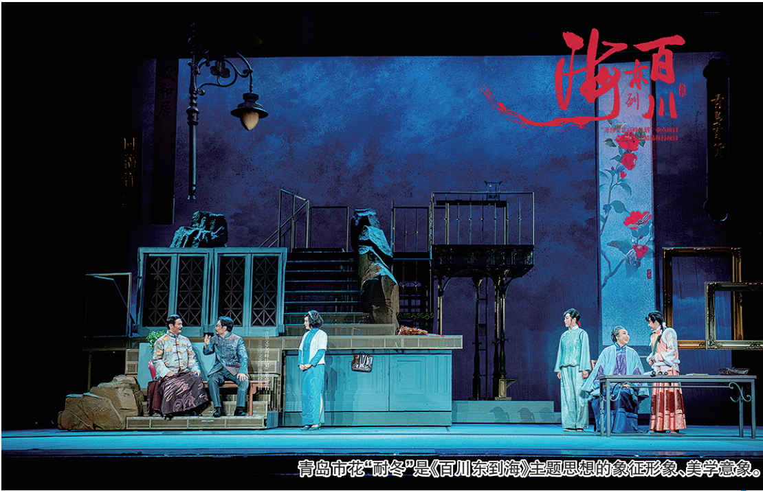
青岛市花“耐冬”是《百川东到海》主题思想的象征形象、美学意象。

青岛的吕剧还好吗？近年来青岛吕剧发展并不理想。山东省文化厅原副厅长陈鹏，是山东吕剧发展的参与者、见证者，在《百川东到海》的专家研讨会上，他特别感慨：“青岛的