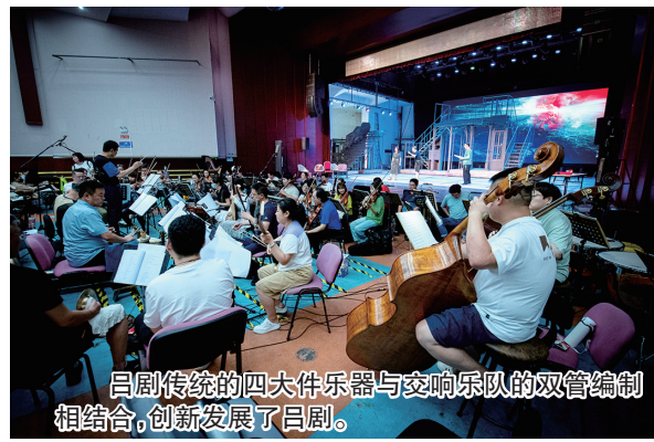
吕剧传统的四大件乐器与交响乐队的双管编制相结合，创新发展了吕剧。

吕剧对青岛戏曲人来说是一个情结，今天得到了一个圆满的答复。青岛有品质有品相的吕剧又立到舞台上了！”