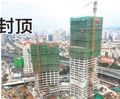
山东港口航运金融中心项目主体结构封顶。

山东港口航运金融中心作为邮轮港启动区首个超高层项目，是山东港口青岛港参与的首个商业开发项目，包含一栋建筑高度130米的办公楼及一栋建筑高度92米的公寓楼，建成后将为邮轮母港启动区提供10.6万平方米的现代化办公及配套设施，承载山东港口投控集团、航运集团、科技集团等新兴产业板块，集聚资金、信息、科技等要素资源，为邮轮港城高质量发