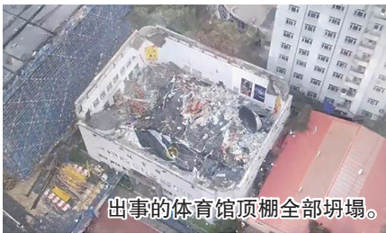
出事的体育馆顶棚全部坍塌。

7月23日下午，黑龙江省齐齐哈尔市第三十四中学一体育馆发生坍塌事故，现场估计十余人被困。截至22时25分，救援力量已营救11人。