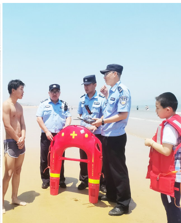
水上救援机器人。(资料照片)

器人不断推向女子,最终让她一把抓住了机器人。随后,民警操作机器人,将女子带回了岸边。