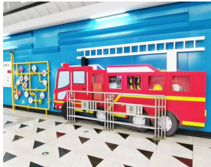
“天目山路”地铁站的消防元素。