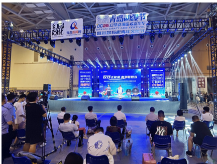
反诈宣传活动现场。市“反诈动漫IP形象征集活动”正式启动。据悉,此次征集活动以第29届青岛

动漫节为契机,面向全社会进行反诈动漫IP形象征集,主办方希望能通过征集活动,把反诈宣传与动漫奇妙融合,让广大群众尤其是青年朋友们更感兴趣参与进来,了解学习反诈知识,进一步浓厚青岛城“全民反诈 全社会反诈”的氛围。