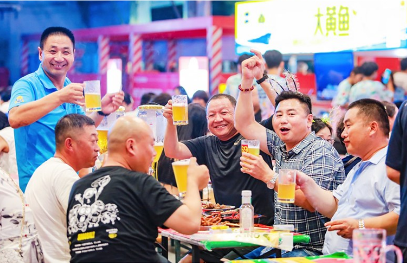
游客在啤酒大篷内畅饮。

此次时装秀为黄发集团创新拓展“啤酒+”运营模式,与山东工艺美术学院开展战略合作,共同呈现啤酒文化时装秀,在推进高等院校创新成果转化的同时,持续放大青岛国际啤酒节平台效