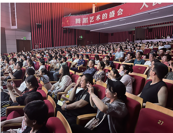
專家評委與觀眾共同欣賞《星河》。

“《星河》全面體現了青島市歌舞劇院青年創作人才的整体水平和綜合實力。”這支青島原創青年團隊，最終完成了從大海到草原的一路閃耀，讓《星河》點亮了全國