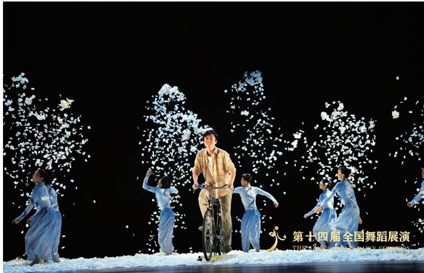
《星河》亮相全國舞蹈展演舞臺。

從海洋到草原，青島《星河》閃耀國家級舞蹈盛會。7月6日，由文化和旅游部、內蒙古自治區人民政府主辦的第十四屆全國舞蹈展演在鄂爾多斯市開幕。青島演藝集團歌舞劇院創演的當代舞劇《星河》於7月9日在鄂爾多斯恰特大劇院連演兩場，這部聚焦現實題材的劇目不僅暖到了現場的暖城觀眾，還通過展演平台讓全國觀眾看見了青島舞蹈的優秀。10日上午，在展演“一劇一評”環節，專業評委也對青島《星河》給予肯定。