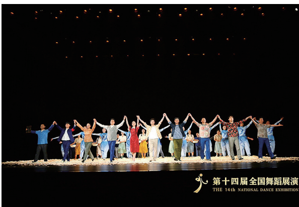
《星河》在鄂爾多斯成功上演。