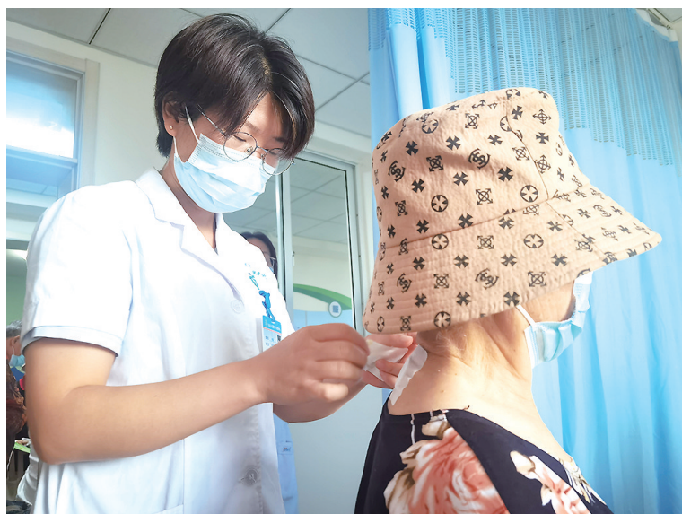
医护人员为群众贴“三伏贴”。