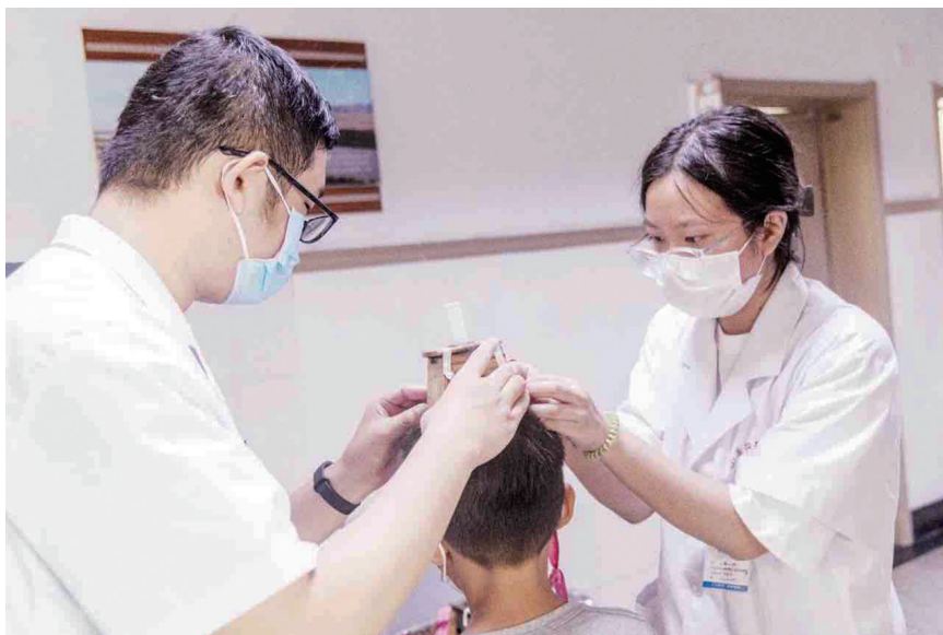
小朋友接受隔物灸。

是咳嗽，喘憋严重，经过连续几年冬病夏治，他感觉冬季发病的次数减少了，症状也逐渐减轻，他表示会继续坚持贴敷，“三伏天里贴敷方便也管用，冬天少遭罪，挺好”。