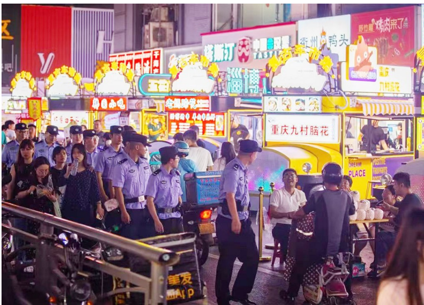
市北分局民警在商圈巡逻。

在崂山区，崂山分局风景区治安派出所、辽阳东路治安派出所、麦岛派出所等基层派出所纷纷派警，对各辖区旅馆业、餐饮、商铺、加油站进行“拉网式”清查。全面排查治安隐患。崂山公安分局共出动警力830多人次，组织群众