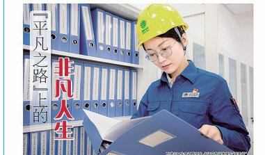
平凡之路上的非凡人生