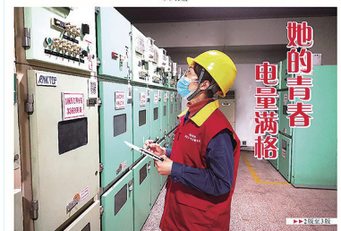
她的青春 电量满格