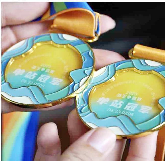
2023 酒王争霸赛单站冠军奖牌。

对酒王争霸赛中每一项赛事了如指掌。比赛中,起杯、放杯是非常重要的环节,高手间的差距往往只有0.2秒左右。在姜国庆手把手的传授下,樊丽萍不断练习起杯、放杯,深呼吸后用吸管喝啤酒,同时,在生活中注意练习气息、提高呼吸频率……久而久之,樊丽萍熟练掌握了技巧,让饮酒速度加快,最终成为了当之无愧的女酒王。今年,夫妻俩更是做足了准备。性格开朗的樊丽萍心态非常好,“参与比赛的初衷其实是重在参与,我也期待与女高手们切磋,如果有人比我喝得更好更快,那么我就借此机会‘退休’了。”