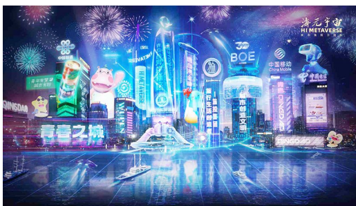
“海元宇宙”即将亮相。

以唐岛湾为背景，以“天涯相融 古今相逢”为主题，“海元宇宙”倾力打造了“奇幻Q桥”“创新球”“海岸未来之城”“海上RAR幻影秀”四大内容场景。