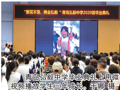
青岛弘毅中学毕业典礼上用微视频播放学生三年成长。于娜 摄