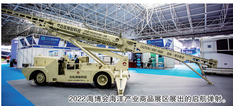
2022海博会海洋产业商品展区展出的启航弹射。

山东海洋集团带来的“PACIFIC INEOS BELSTAFF”轮,采用全球首制的“BrilliantE”B型液货舱的创新设计,专为液化乙烷的长途运输而设计,实体船总长230.0米,型宽36.6米、型深22.5米,配有4个B型液货舱和2个C型甲板罐,入级美国船级社(ABS)和中国船级社(CCS),满足最新的国际散装液化气规则(IGC)、国际海事组织