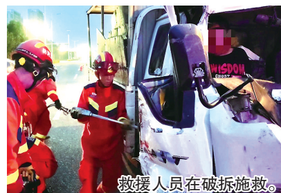
救援人员在破拆施救。

振中街消防救援站到场后发现,一辆小货车因车速过快追尾前方大货车,小货车车头受到挤压严重变形,副驾驶座上一名男青年双腿被驾驶室卡住。救援人员询问医护人员注意事项后立即实施救援,一名救援人员对被困男子做好保护,防止施救过程中造成二次伤害。另外几名救援人员使用多功能撬棍、扩张钳等工具破拆车门和车头,并用撬棍顶撑,期间不断安抚被困男子的情绪。