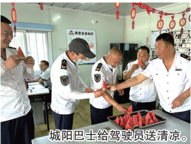
城阳巴士给驾驶员送清凉。

“太热了,大家快来吃块西瓜解解暑!”面对严峻“烤”验,城阳巴士后勤工作人员为当班一线驾驶员们送去了西瓜、矿泉水、冰袋等,并嘱咐他们增强高温天气下的安全行车意识,继续高质量服务好乘客。公司食堂还每日熬煮绿豆汤,以供职工消暑食用。城阳巴士第十三分公司别出心裁,为在岗职工准备了降温大礼包,包里有防晒冰袖、金嗓子喉宝、擦汗毛巾等。清凉油、藿香正气水、“萤火爱心牌”解暑