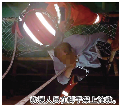
救援人员在脚手架上施救。

救援人员来到5楼老人家门口,征得老人女儿同意后,破门进入家中。为防止老人体力不支,救援人员将安全绳固定板从窗口扔下,让老人佩戴好以便做好安全措施,随后展开营救。一名救援人员从五楼窗口降至老人被困位置,另外两名救援人员在四