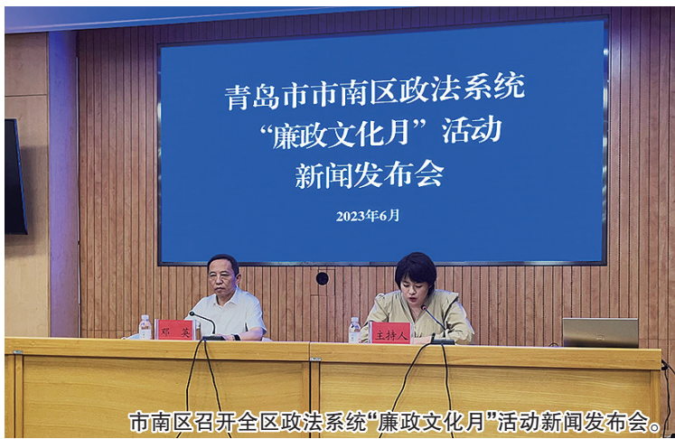
市南区召开全区政法系统“廉政文化月”活动新闻发布会。

发布会还介绍了市南区政法系统近年来严格落实全面从严治党、加强党风廉政建设有关工作情况,推进实