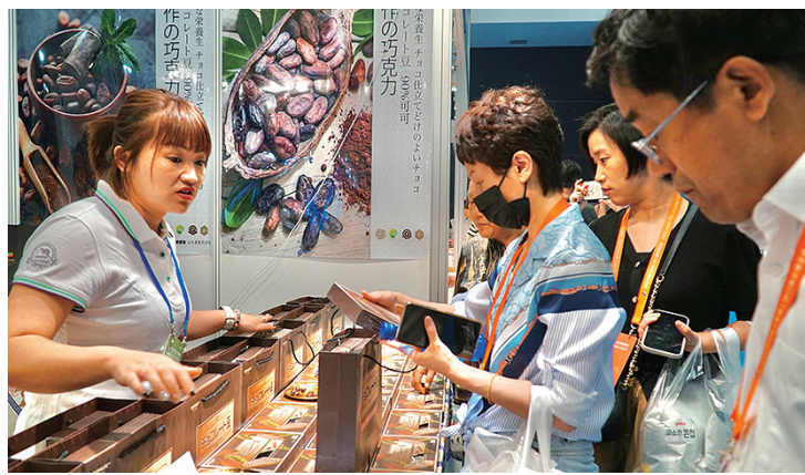
博览会首日,不少市民前来参观、购物。

日韩商品展、产业对话会、动漫嘉年华……6月21日,2023日韩(青岛)进口商品博览会在红岛国际会议展览中心盛大开幕,多场精彩活动同期举行。