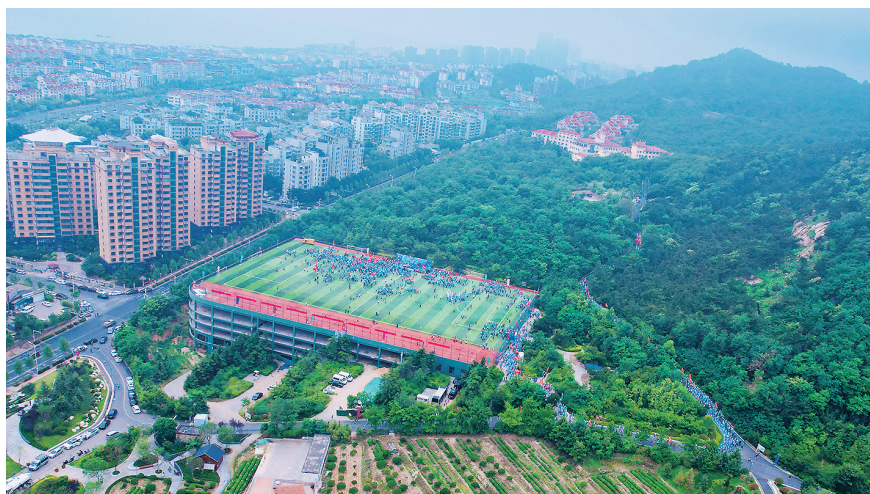
俯瞰浮山健步行活动。

海雾缥缈,缠绕着浮山顶;海风轻拂,凉爽着青岛人。全国多地迎高温“烤”验,青岛依旧用凉爽天气回馈着运动市民。在这样一个适合运动的日子,17日上午,浮山绿道热闹非凡,“感受精彩宜人 见证实干实绩”2023青岛环浮山绿道健步行活动在青岛浮山森林公园举行,146个团队、3500多名市民,举行浮山绿道正式开放以来的首个大型环山健步行活动,绘出全民健身火热画卷。