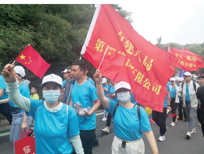
市民积极参加健步行活动。