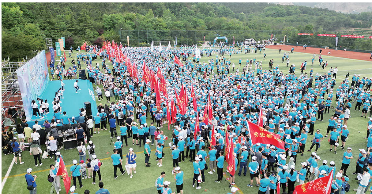
浮山健步行引来3500多人参加。

此次健步行活动,让广大参与者以运动健身的方式走进青岛城市更新、城市建设带来的全新空间,感受“活力海洋