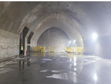
地铁8号线五四广场站主体结构施工完工。

本报6月14日讯 作为青岛地铁8号线最后一个暗挖车站，五四广场站由于区位复杂，是8号线施工中的“卡脖子”节点。14日，记者从地铁集团获悉，随着最后一车混凝土浇筑完成，最后一段中板结构顺利施工完成，标志着该车站主体结构完成，比计划节点提前3个多月。