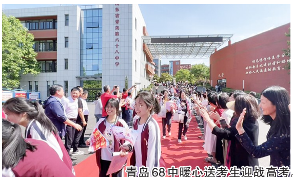
青岛68中暖心送考生迎战高考。

本报6月5日讯 走上红毯、穿过状元门、与身穿红色送考服、夹道相送的校长和老师击掌拥抱……6月5日下午,青岛68中全体高三学生在加油鼓劲的祝福中走出校门,信心满满地“出征”,踏上高考路。