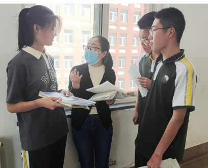
老师在课间为高三学生答疑。

他们中大多数住在离学校和考点较远的地方,因此在高三的最后一周,他们只能继续在学校度过。即便如此,在老师们的精心呵护下,他们依然有条不紊、多姿多彩地度过这非同寻常的一周。老师为同学们提供最耐心的答疑,陪伴他们的一日三餐,甚至在每天天下晚自习后,老师们还走进宿舍,陪同学们聊天。而老师们所做的一切,都是希望同学们能自信满满地走进考场,考上自己理想的大学,迈向自己期待的人生之路!