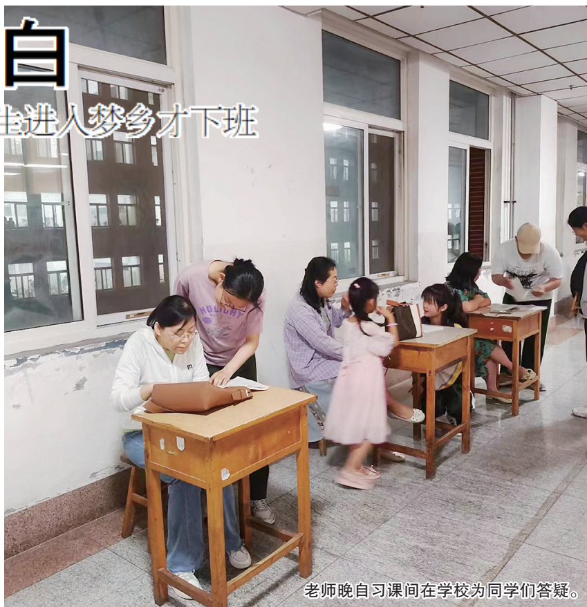
老师晚自习课间在学校为同学们答疑。