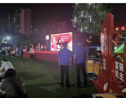
城阳区综合行政执法局开展“为考生送安静”专项执法行动。

本报6月5日讯 高考临近,为保障考生能够安静备考、安心应考,城阳区综合行政执法局、城阳区公路中心等部门已经行动起来。