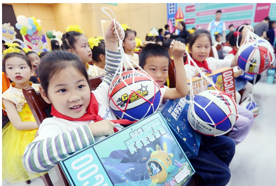
小朋友领取心愿包。

“我想要新书包!”“我喜欢下象棋!”“我喜欢写书法!”这些萌娃们的“微心愿”，28日都实现了。“六一”国际儿童节到来之际，中铁建工青岛西海岸肿瘤医院项目举行特别演出：由共青团青岛市委、青岛市委住房和城乡建设局主办，中铁建工第二建设有限公司、共青团青岛西海岸新区委员会联合承办的青岛市“益路童行 结对帮扶”建设工地暖心驿站志愿服务活动暨“希望小屋”儿童关爱项目举行，中铁建工“筑梦”志愿服务队的志愿者们为周边社区的少年儿童、建筑工人子女代表实现“微心愿”，让他们在项目上提前度过一个别样“六一”。