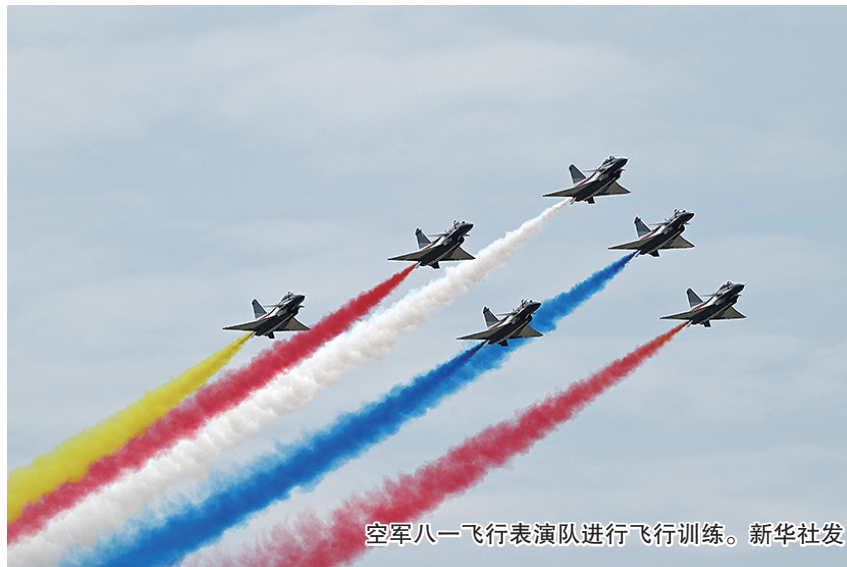
空军八一飞行表演队进行飞行训练。

新华社北京5月16日电 中国空军新闻发言人谢鹏16日介绍,按照空军装备建设发展规划,空军八一飞行表演队换装歼-10C飞机。据悉,他们将参加于5月23日至27日在马来西亚举行的第十六届兰卡威国际海事和航空展,这是表演队此次换装后首次飞出国门。