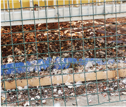
鸽舍每天产生的粪便严重扰民。

青岛信鸽协会的会员，从1992年开始就在家养了这几百只信鸽，用来参加各类比赛，特别强调信鸽与家鸽不同，而鸽舍也不是违法建筑，它只是一个体育设施，拒绝自行拆除。执法人员向当事人讲解政策，根据《青岛市市容和环境卫生管理条例》第五十五条规定，禁止在住宅楼外立面、楼梯、楼顶、走廊等搭建鸽舍、犬舍等禽畜笼舍。经过沟通，当事人同意配合拆除鸽笼。