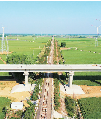
无砟轨道施工正式拉开序幕。

本报5月14日讯 12日，中铁十局承建的潍烟高铁1标段昌平特大桥首段无砟轨道底座板正式开始混凝土浇筑，标志着潍烟高铁青岛段无砟轨道施工拉开序幕。潍烟高铁昌平特大桥无砟轨道施工长度11.516千米，包含GRTSⅢ型轨道板2064块，其中包含P5600型1204块、P4925型620块、P4856型240块。