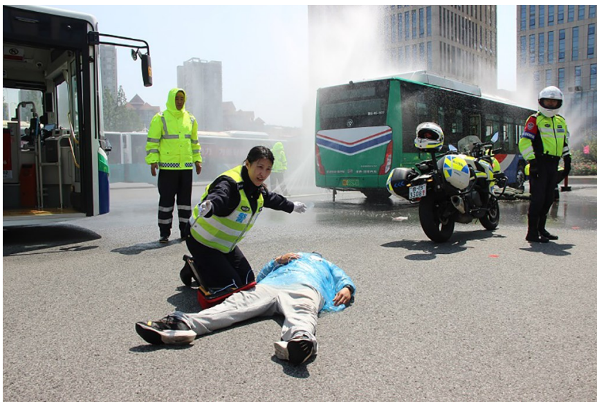
模拟人员受伤处置。

“车怎么晃起来了?”“请大家不要惊慌,听我指挥,离开座位,躲到椅背旁边,双手抱头、蹲下避险。”演练现场,一辆载有十余名乘客的607路车