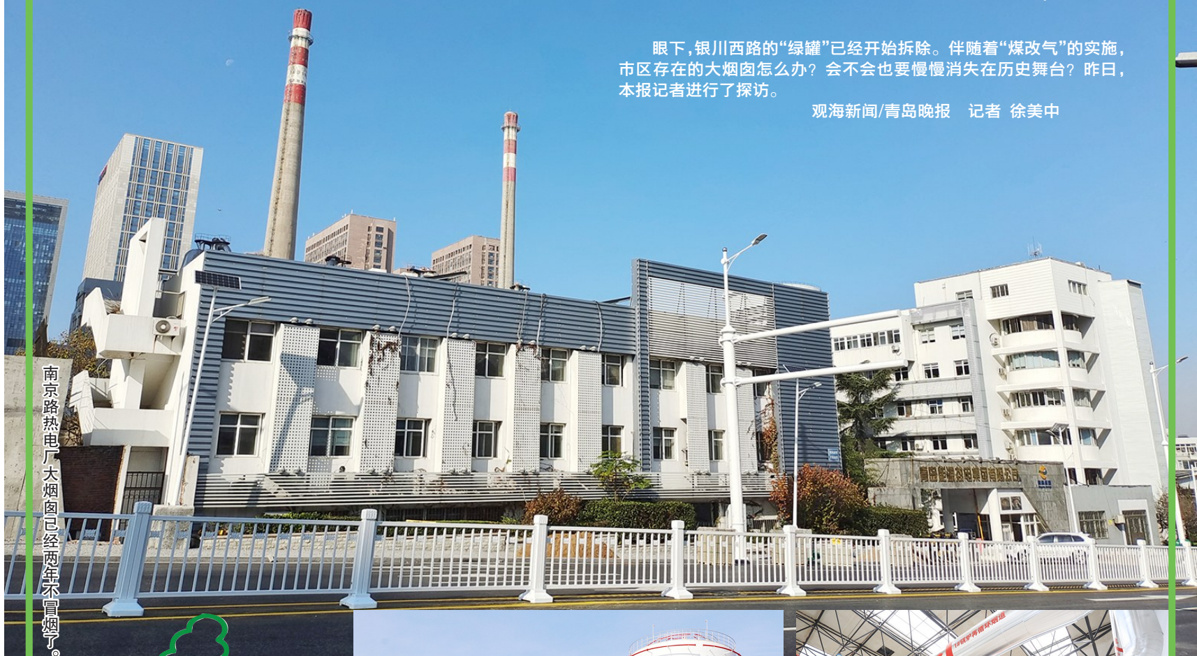
南京路热电厂大烟囱已经两年不冒烟了。