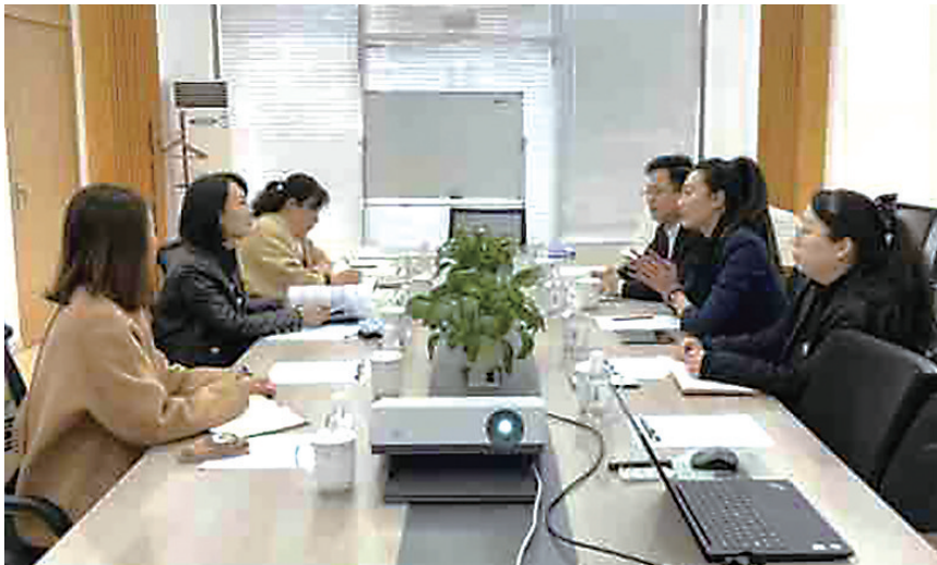
面对面把政策送进企业。

在合肥路街道，创业不用愁，有导师来帮忙。通过推出创业导师制度，招募不同行业领域的工作人员作为创业导师，定期开展拓展训练、头脑风暴、职业分享沙龙等活动。截至目前，合肥路街道退役军人就业创业孵化基地已入驻企业130余家，实现年税收1000万元。目前，街道成功引入的青岛益生元