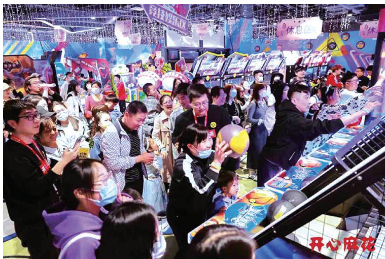
大剧场演出场场爆满。