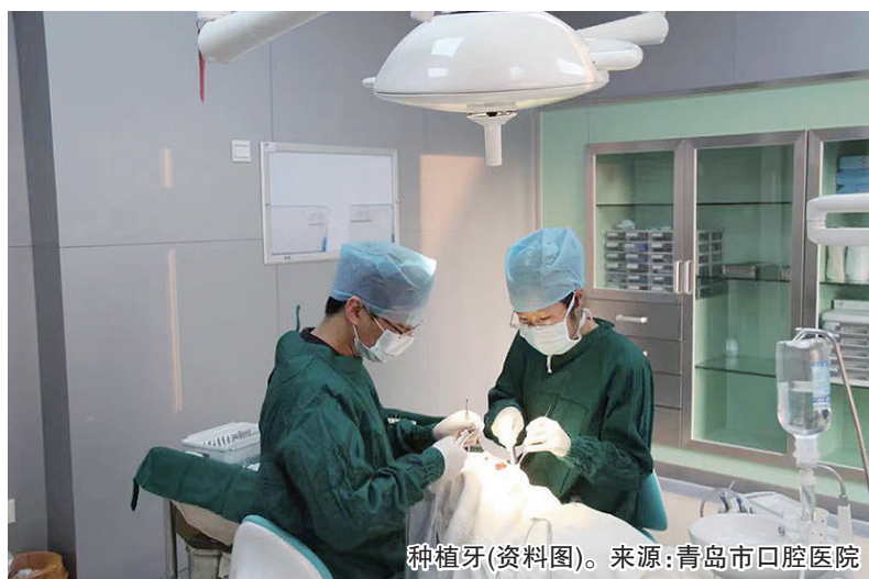
种植牙(资料图)。

记者从青岛市医保局获悉,市医保局认真落实国家、省工作部署要求,聚焦口腔种植医疗服务、种植体和牙冠三个方面综合施策,“三位一体”开展口腔种植价格专项治理。目前,口腔种植医疗服务、种植体、牙冠三方面治理成效全面落地执行,患者将切实全面享受到口腔种植价格专项治理成果。