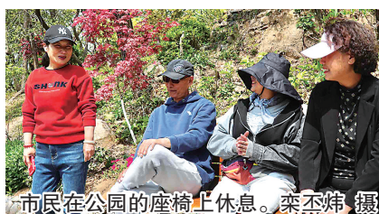
市民在公园的座椅上休息。