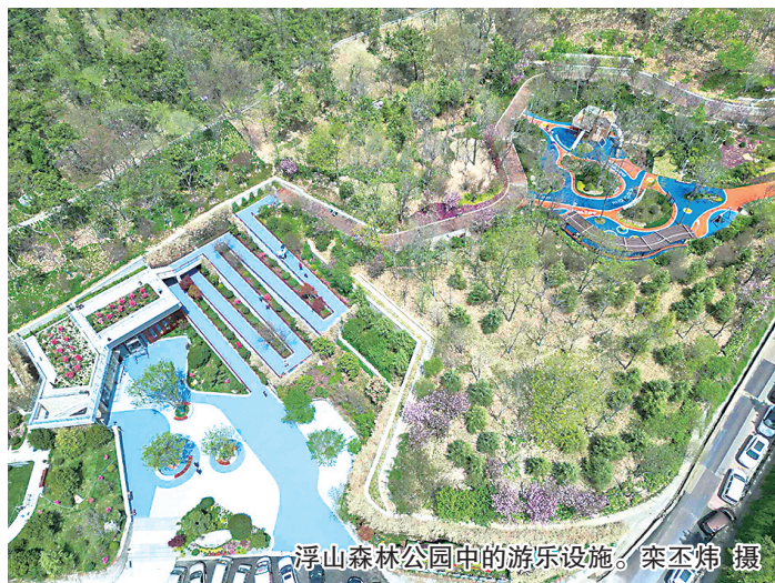
浮山森林公园中的游乐设施。

站在山上眺望，市区多个山头连绵绿意，山海一线，这是独属于青岛人的美景。在山头建公园，让市民能登山、能游园，彰显山海城的共生魅力，这是青岛城市更新和城市建设三年攻坚行动的重要命题。随着太平山中央公园、浮山森林公园基本建成并于4月27日正式对市民开放，市民踏青又多了好去处。风景美，山头绿，“两山”公园抬脚就能进，逛累了就能撤，腿酸了随处坐，处处细节彰显服务便民的初心。