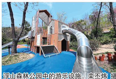
浮山森林公园中的游乐设施。