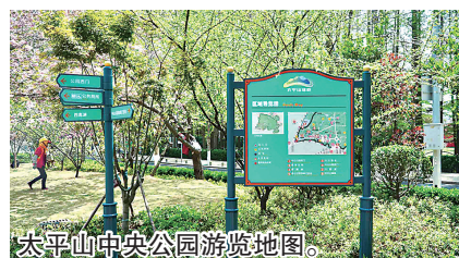
太平山中央公园游览地图。