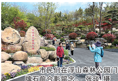
市民们在浮山森林公园门牌石前合影留念。