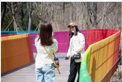
游客打卡太平山绿道彩虹桥。

据介绍，太平山中央公园建设整治过程中，开放中山公园东部桃园、苗圃及提升太平山北部山林区域共60余万平方米，实施采石坑治理和水系疏理等生态修复，打造了桃源山语、海棠春榭、登高观景线等一批特色景观园区、节点，不断拓展绿色空间，最大限度满足市民休闲健身所需。