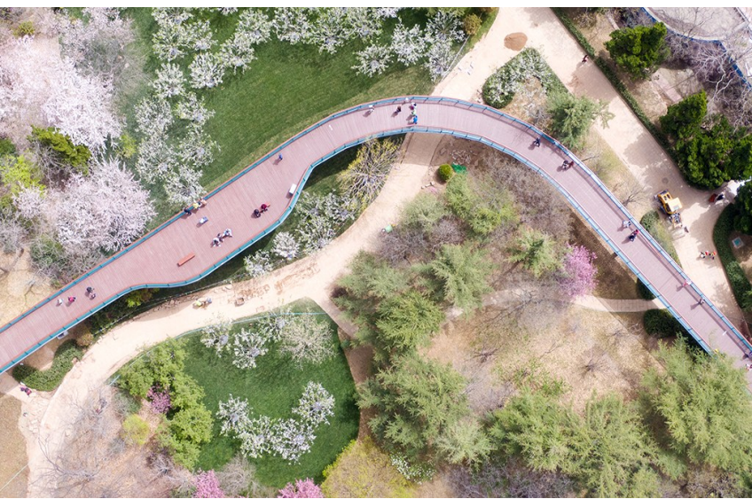
太平山延安一路景观桥景致宜人。

公园城市建设是引领城市生态文明发展的新范式，也是满足人民群众美好生活需要的重要途径。眼下，这场人与城“双向奔赴”的时代故事，正被生动、具象地演绎出来。浮山被称为青岛的“城市之肺”，太平山的美景则持续入选“青岛十景”“青岛新十景”，可以说，青岛人对这两座山头公园是情有独钟。