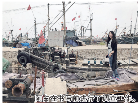
阿占在书写前进行了调查工作。

需要强调的是——《海货》不是从渔歌入手的，虽然渔歌号子是渔家的信天游，有领有合，朗朗上口，随潮汐派遣。潮汐有多跌宕，号子的层次就有多丰沛。撑篷号、箍桩号、拿船号、推