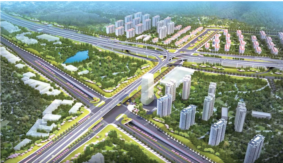
青银高速公路增设唐山路互通及连接线工程效果图

备受市民关注的青银高速公路增设唐山路互通及连接线工程近日取得《建筑工程施工许可证》，21日，该项目正式开工建设。据了解，该项目是城市更新和城市建设三年攻坚行动重点工程，是《青岛市中心城区路网规划》中“七横九纵”快速路网的“第四横”，是中心城区路网结构的重要组成部分，项目地处李沧西部湾区，横贯李沧西、中、东三大组团，是“东西贯通、多组团辐射”的区域一体发展的重要轴带，对全市经济持续健康发展、李沧区城市更新改造提升及构筑大青岛城市框架具有重要意义。