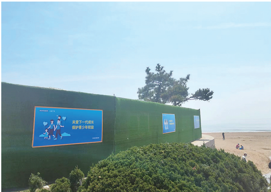
崂山区规范化整治围挡。

据了解，崂山区城市管理局在前期深入调研的基础上，进一步明确围挡设置的整治要求和整治标准，制定了《崂山区围挡规范化整治提升行动工作方案》，压实部门责任，强化行业管理，组织各相关行业部门、街道办事处，对围挡及周边存在的环境卫生、市容秩序问题持续排查整改，让围挡焕发“新颜值”。目前共计整改提升围挡问题40处、5240平方米。