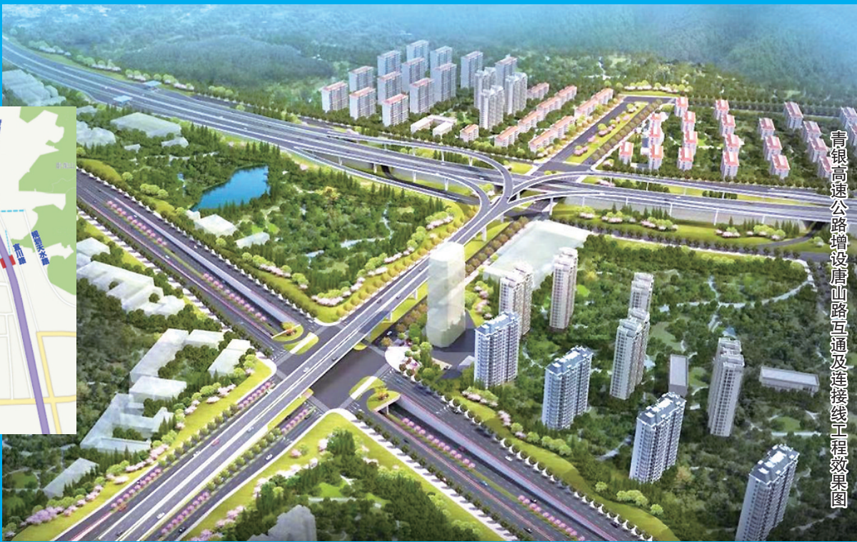
青银高速公路增设唐山路互通及连接线工程效果图