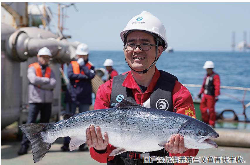
国产深远海养殖三文鱼再获丰收

西北距青岛市约120海里,位于黄海冷水团区域,总面积553.6平方公里,是全国首个、也是目前唯一一个国家级深远海绿色养殖试验区。