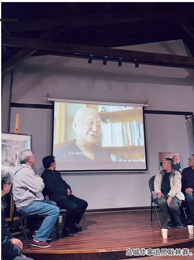
岛城作家追思耿林莽。

“先生已去,精神永存。他将自己的一生写进了中国散文诗的发展历史之中,成为一座丰碑。”4月14日下午,“落日也辉煌”耿林莽追思会在良友书坊·塔楼1901举行,岛城文学界人士共聚一堂,追思这位在中国散文诗领域作出卓绝贡献的开拓者和代表者,同时也是为青岛文学事业作出杰出贡献的先驱者。