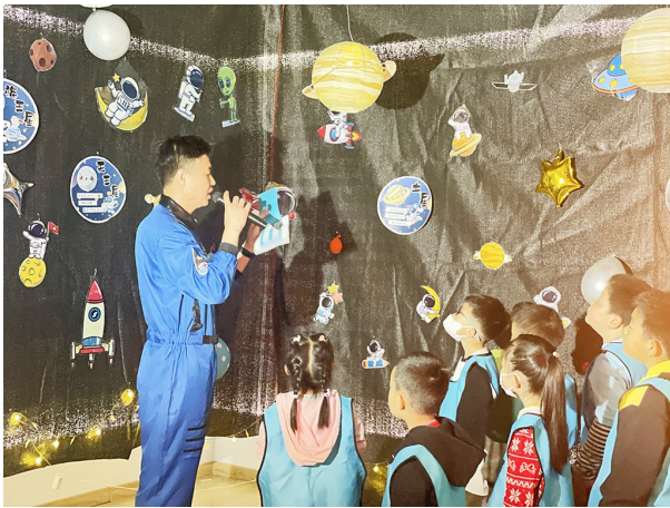
崂山金家岭“北极星”科普讲堂开课。

在“星空长廊”部分,社区科普老师带领孩子们走进“浩瀚神秘宇宙”,用边走边看、边讲的方式带领大家学习宇宙星空小知识,领略宇宙星空的魅力。穿越