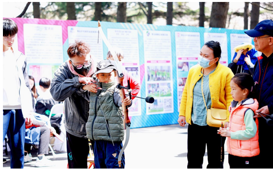
活动专门设置了体育品牌展示区,吸引了市民游客前来打卡。

本次活动自4月14日启动,持续开展至4月17日。正值第三届青岛樱花节举办期间,据悉,本次活动专门设置了体育品牌展示区,吸引了包括棒球、冲浪、帆船、跆拳道、橄榄球、滑雪等20余家服务机构进行现场集中展示。此外,体育互动体验区还组织了飞盘、棒球、腰旗橄榄球、乒乓球、运动模特走