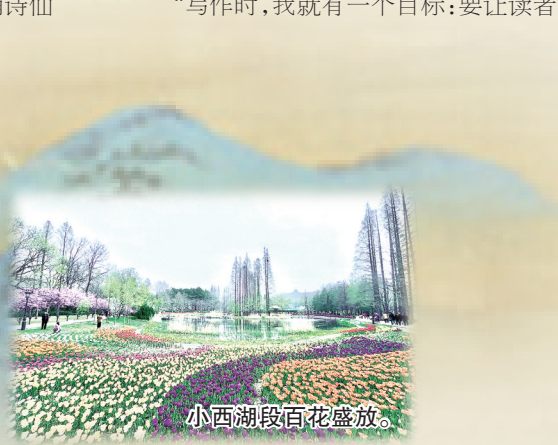
小西湖段百花盛放。