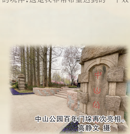
中山公园百年门墩再次亮相。