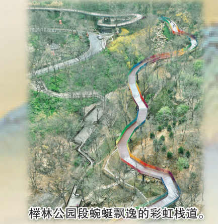
桦林公园段蜿蜒飘逸的彩虹栈道。