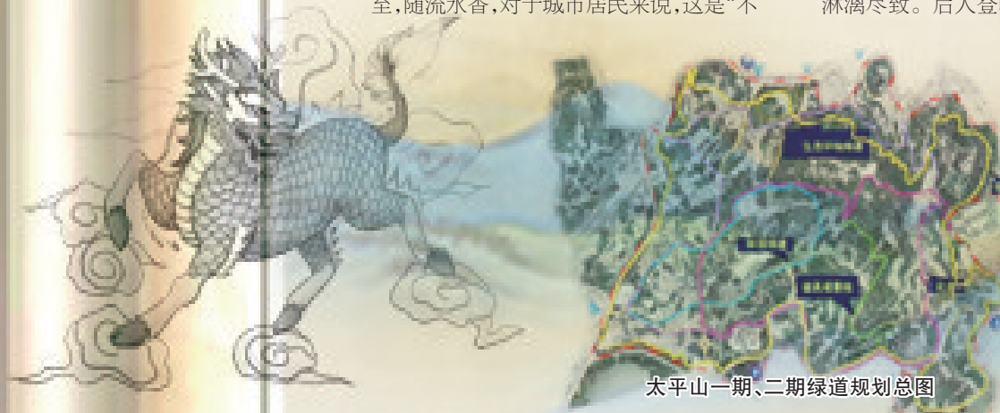
太平山一期、二期绿道规划总图